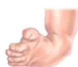
Piede torto 1 su 1.000