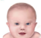
Sindrome Down Dipende dall'età materna 20 a=1 su 1.450 – 44 a=1 su 33