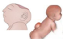
Difetti del tubo neurale (Anencefalia – Spina Bifida) 1 su 1.000