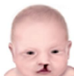
Labio/palatoschisi 1 su 800